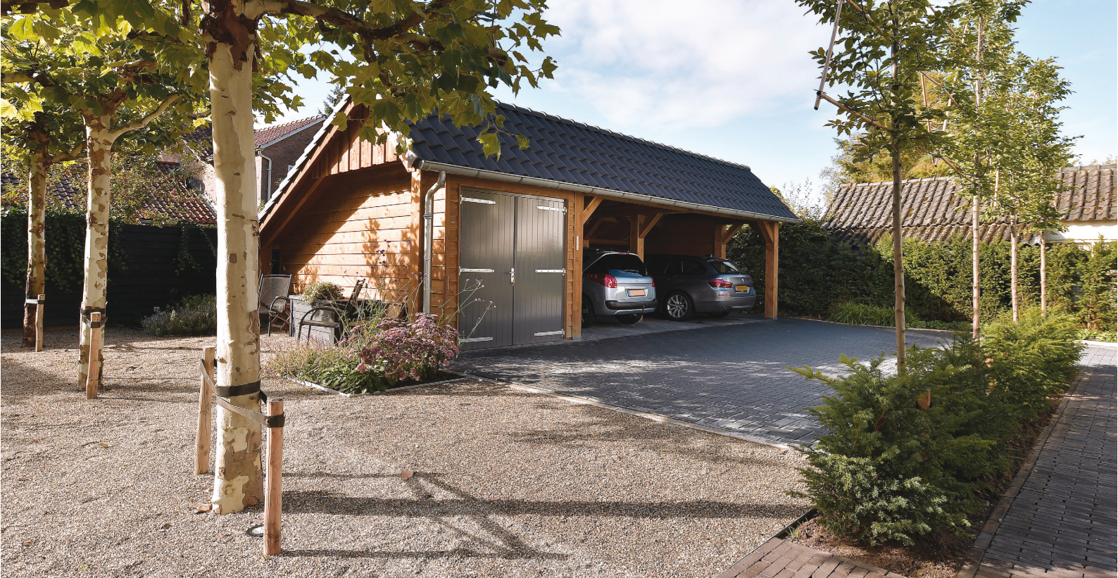
De dubbele carport met schuurgedeelte en houtopslag werd gebouwd en gemonteerd door Geldersche Houtbouw.