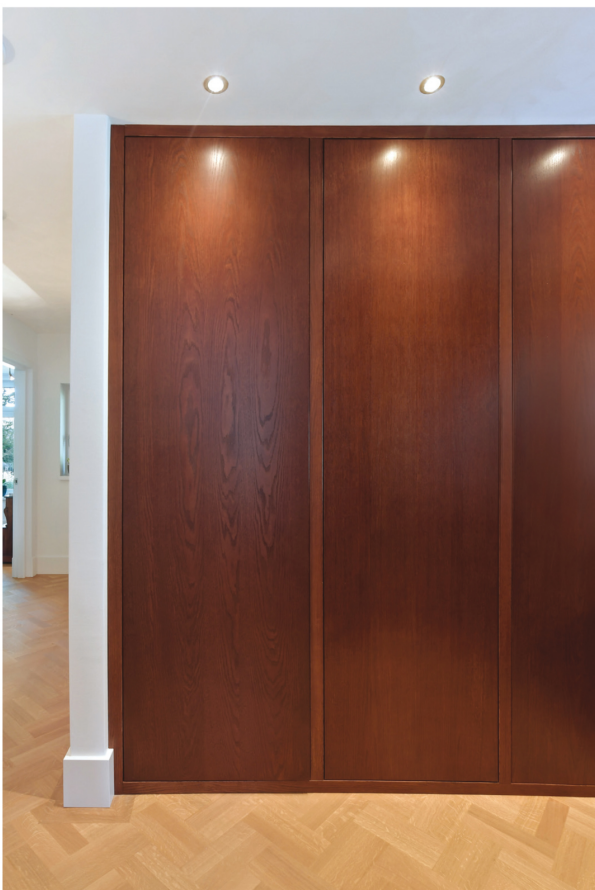
De eikenhouten vloer in de hoogste sortering werd vakkundig in visgraatmotief gelegd door Naturo Vloeren. De vloer werd gelegd met een band rondom en afgewerkt met een hardwax olie.

De badkamer op de benedenverdieping bestaat uit een ruime inloopdouche met dubbele wastafels. Henk wijst naar de muur: “Let op dit detail: er zitten alleen tegels waar nodig. De rest is mooi strak gestuukt.”