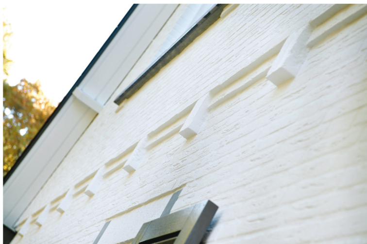
Door de gevel te keimen krijgt deze een heel andere uitstraling en blijft hij toch ademen.

Ook de keuken vormt een mooie combinatie tussen comfort, eigen inbreng en een perfecte afwerking. Zo zijn de plinten in het huis overal twintig centimeter hoog, passend bij de stijl van het huis en aansluitend bij de borstwering van de deuren. De hoogte van de ramen en de deuren is hetzelfde en vormt daarmee één lijn. Ook de aftrimming van de ventilatie is zorgvuldig verwerkt in de raamkozijnen. Het keukenblad is van Dekton. Een Dekton werkblad heeft een natuurlijke uitstraling maar heeft niet de nadelen van natuursteen. Het is gemakkelijk schoon te houden, is sterker dan composiet en slijtvaster dan graniet. De keuken heeft verder veel notenhouten accenten die passen bij de rest van het interieur. “Deze brede schuifdeur is een idee van Henk”, zegt mevrouw. “Ik vind een open keuken leuk, maar ik ben toch een beetje een rommelaar en dat hoeft je vanuit de huiskamer niet te zien. Dit is een mooie oplossing.”