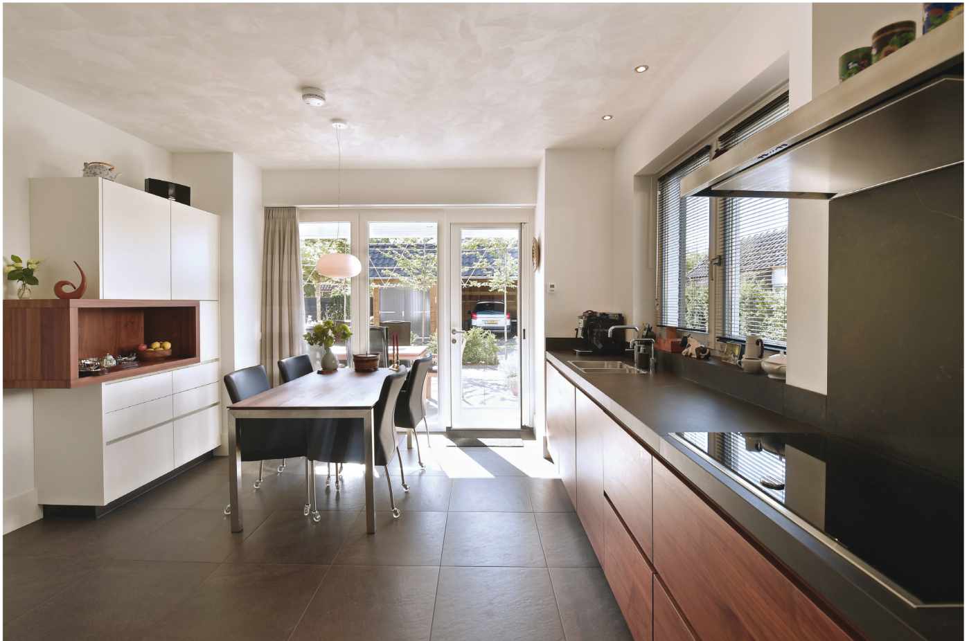
De warme keuken van Coenenspark heeft een perfecte afwerking.