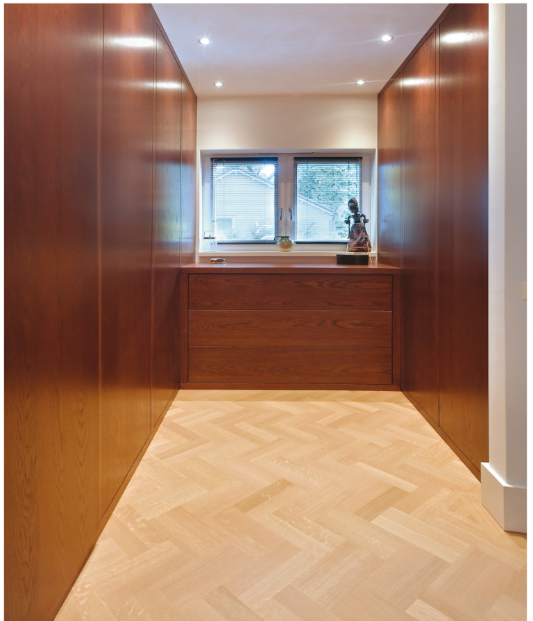
De inloopkasten werden op maat gemaakt door Delade Interieurbouw.