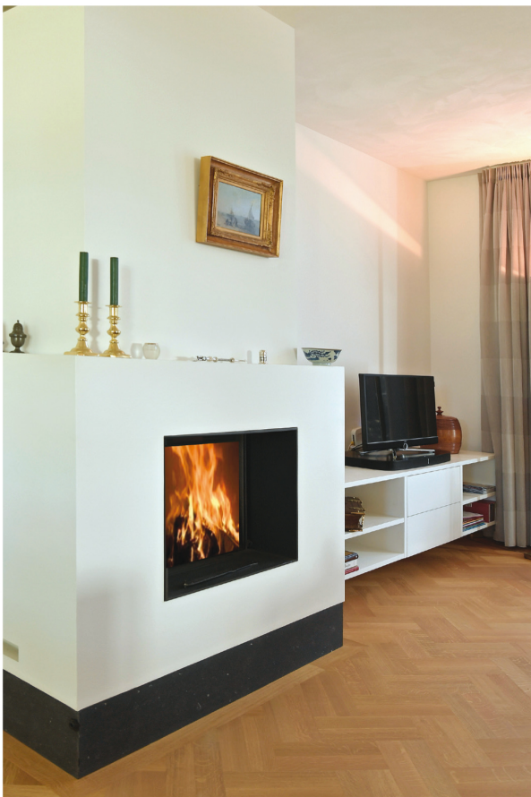
Het strakke stucwerk en de dekvloeren werden gerealiseerd door Ter Woerds Afbouw. De houtgestookte liftdeurhaard van Kalfire is afkomstig van Wichink Kruit Kachelspecialzaak.

“Een mooie, warme dorpsvilla die met veel aandacht voor detail is gebouwd”