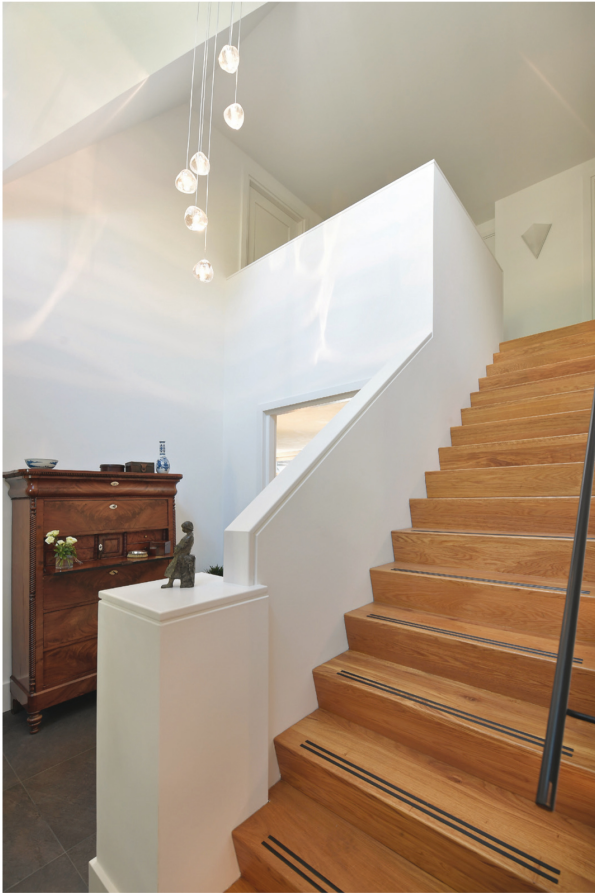
De houten trap werd gerealiseerd door Rozut Houtbewerking, net als de deuren inclusief deurgrepen.

deur laten vervallen en een extra muur gecreëerd om dingen op te hangen. Een ander detail dat we hebben overgenomen van het oude huis is het geschuurd plafond. Het wordt tegenwoordig niet meer zo vaak toegepast, maar wij vinden het mooi en levendig.”