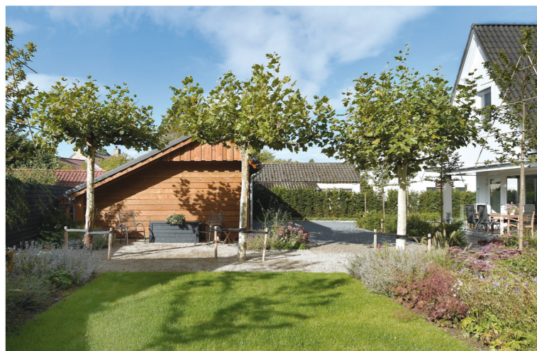
Met het ontwerp en de aanleg van deze tuin creëerde Luijendijk Hoveniers een plaatje.

Dit project werd mede gerealiseerd door: