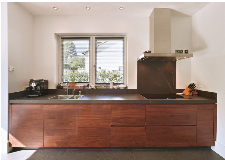
De ventilatie is zorgvuldig, en dus bijna onzichtbaar, verwerkt in de raamkozijnen.

“Ook de keuken vormt een mooie combinatie tussen comfort, eigen inbreng en een perfecte afwerking”