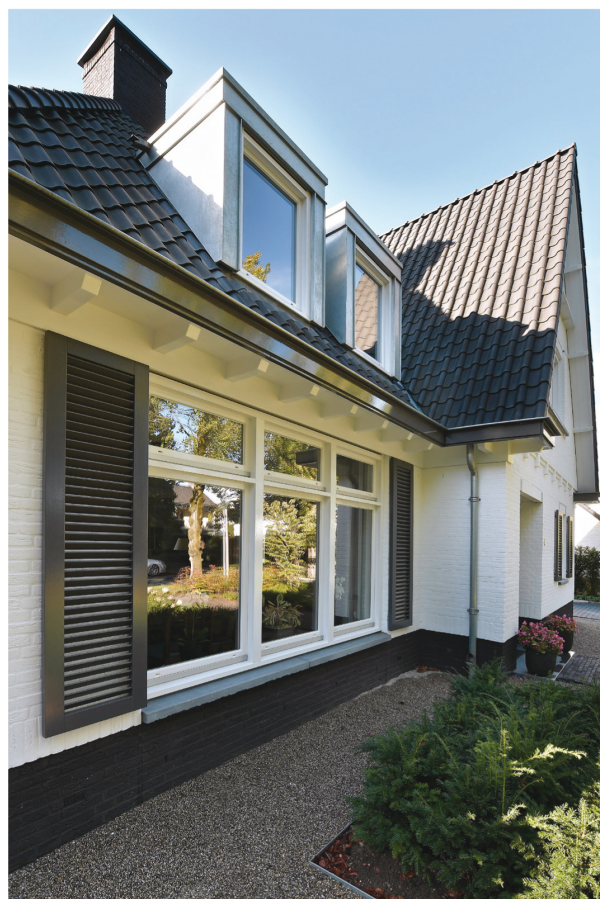
Schilderwerk is bij ieder project zowel van binnen als van buiten van groot belang. Hier werd dit gedaan door Schildersbedrijf W. Meekes.