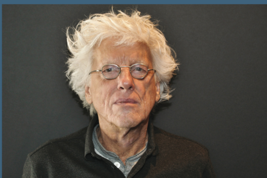
Architect Henk Leeftang

De elegant ingerichte woonkamer is ruimtelijk. Op de vloer ligt eiken visgraatparket. De klassieke zitbank biedt uitzicht op de grote platanen in een symmetrisch aangelegde tuin met in het midden een bescheiden waterwerk. Onder de tuin zijn waterfilters geplaatst die regenwater opvangen en langzaam teruggeven aan de bodem. “Wij wilden graag de meubels die we hadden, behouden. Je zou de stijl klassiek kunnen noemen, maar wij noemen het van alles wat. Het past bij ons. Aan onze schilderijen hechten we eveneens veel waarde. Zo hebben we een